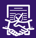
지점 개설 계약