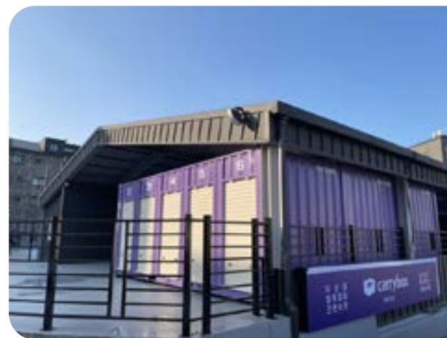
주차장 옆 유휴지를 활용한 화성시청점

*창업비용은 상가 및 대지 상태에 따라 상이할 수 있습니다. 전기 및 보안설비 비용은 포함되지 않았습니다.