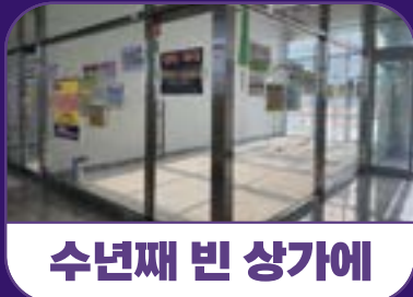
수년째 빈 상가에