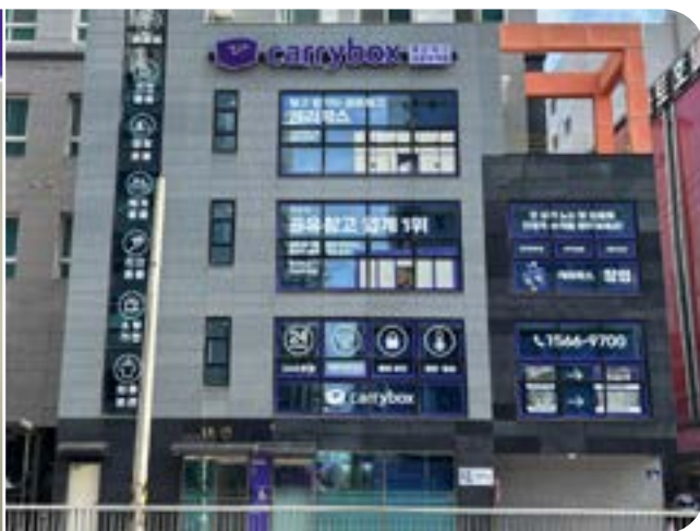
공실 건물 전체를 활용한 의정부역점