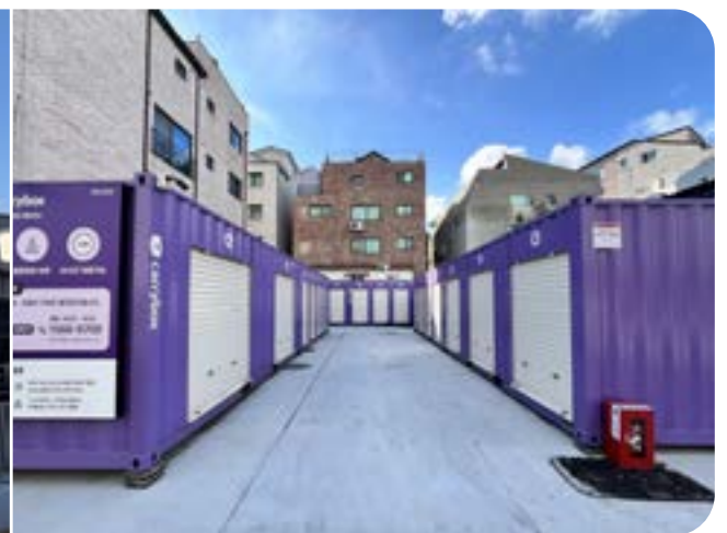
주택가 좁은 필지를 활용한 동탄능동점