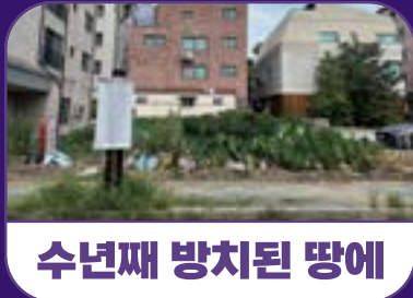
수년째 방치된 땅에