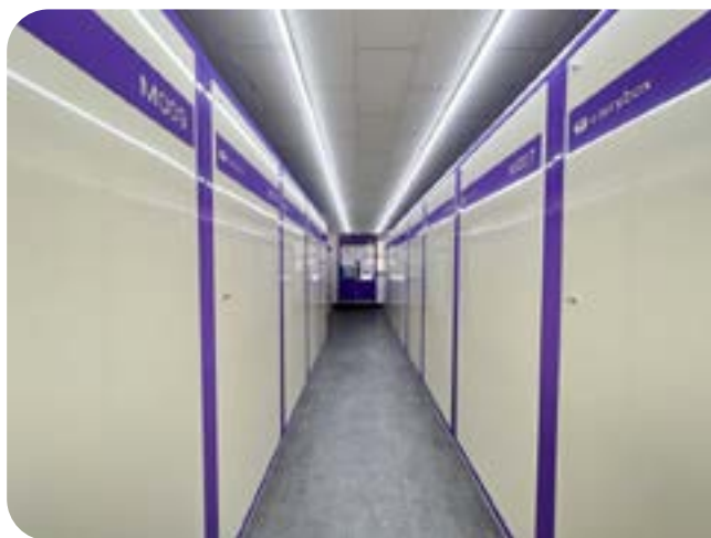
장기 공실을 활용한 평택고덕점

*창업비용은 상가 및 대지 상태에 따라 상이할 수 있습니다. 전기 및 보안설비 비용은 포함되지 않았습니다.